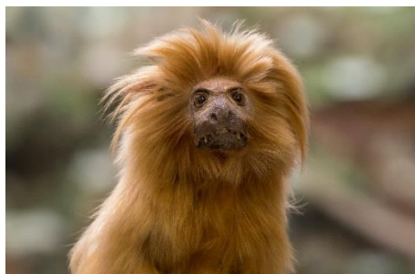
Gouden Leeuwaapje - Leontopithecus rosalia (detail)