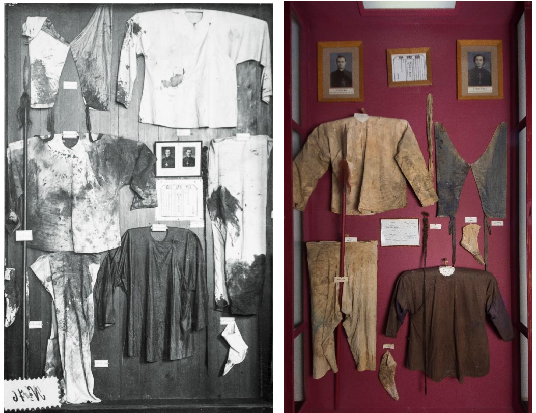
Vitrine Henle & Nies

Bezoekers hebben, voordat ze de zalen van het Missiemuseum ingaan, context nodig. Met een introductie die alle perspectieven toont. Musea worden zich steeds meer bewust van de eigen geschiedenis en de wijze waarop de presentaties, maar ook de herkomst van de collectie, een afspiegeling zijn van de tijd waarin ze zijn ontstaan, de toenmalige (koloniale) verhoudingen en de beeldvorming die dat met zich meebracht. Als de bezoeker zich bewust wordt van de geschiedenis en de beeldvorming, die aan de presentatie ten grondslag ligt, wordt zijn/haar bezoek interessanter. Het verrijkt het verhaal en brengt het meer bij de tijd. Daarbij is meerstemmigheid het uitgangspunt, in dialoog met het publiek. De perspectieven die het museum daarbij aan bod laat komen zijn in elk geval die van de SVD-missionarissen toen en nu, van gemeenschappen uit herkomstlanden in Nederland en van gemeenschappen in de herkomstlanden zelf.