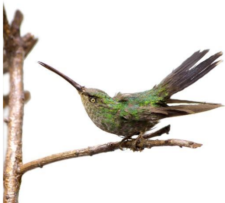
Buffons pluimkolibrie – Chalybura buffonii (detail)

De huidige conditie van de collectie is niet geheel bekend. Het deel waar tot nu toe een beeld van is, is niet in slechte staat, maar heeft in de toekomst aandacht nodig. De objecten zijn vooral stoffig en hebben lang geen onderhoud of controle gehad. Enkeligen hebben beschadigingen. Deze zijn voornamelijk afkomstig door ouderdom en vuil.