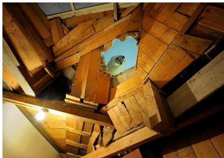
Ijsbeer gezien vanuit de achterkant van de stelling in de diervitrine.