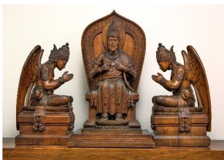
Zittende Heilig Hart voorstelling, met aan weerszijden een zittende engel met handen in bidhouding

eerste gezicht een etnografisch verhaal lijken te vertellen, zit er in veel gevallen een missieverhaal achter. Het staat er, omdat het iets laat zien over bekeringen of over 'heidense' gebruiken. De natuurhistorische collectie is verdeeld in een insectenkabinet en een zoölogisch gedeelte. De overweldigende dierenverzameling bestaat uit opgezette zoogdieren, vogels, reptielen, amfibieën en vissen. De open diergroep met giraffe, antilopen, runderen, leeuwen en zebra's ligt centraal in het museum. Tot de collectie behoren ook bedreigde en uitgestorven diersoorten. De diversiteit aan paradijsvogels is opvallend en stamt uit het missiegebied in Papoea-Nieuw-Guinea. Het insectenkabinet met zijn duizenden tropische vlinders, schorpioenen, spinnen, kevers en andere insecten is oorspronkelijk verzameld voor schoonheid, wetenschap, educatie en handel. De vlindercollectie is verder aangevuld uit schenkingen van Latiers, Hermans, Ottenheijm en hebben een hoge wetenschappelijke en educatieve waarde. In deze collecties bevinden zich veel Nederlandse vlinders en waardplanten.