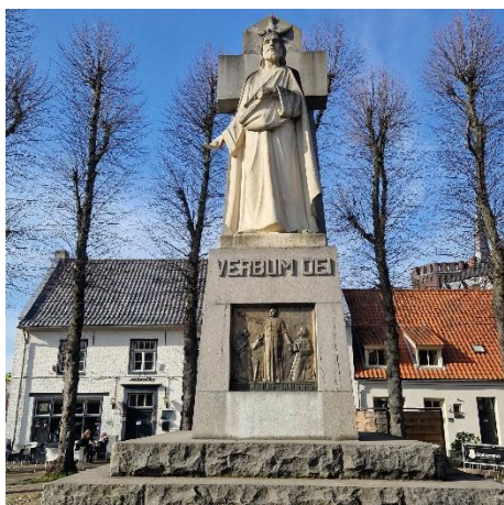
'De Goddelijke Zaaier'