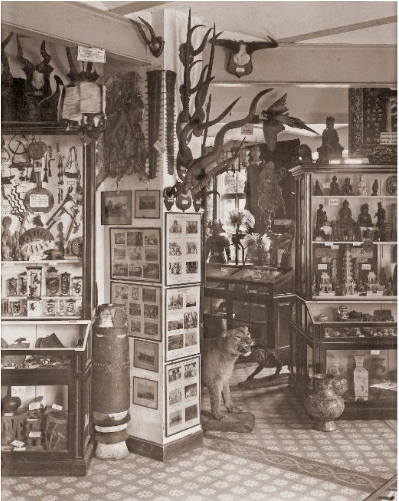
Impressie van de opstelling in de voormalige drukkerij Digitale scan van een glasnegatief, 1894-1931 Missiehuis St. Michael (SVD), langdurig bruikleen, 1931.