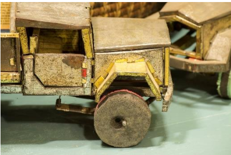
Voertuig van metaal (detail)

Nog niet opgenomen in registratie. Herkomst: Centraal Afrika. Missiehuis St. Michael (SVD), langdurig bruikleen, 1931.