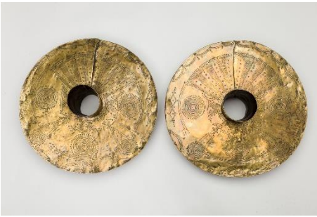
Paar Ogba enkelbanden