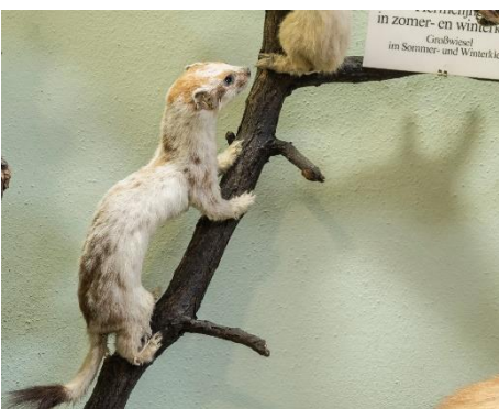
Hermelijn – Mustela erminea