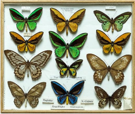
Vlinderlade met exemplaar van Br. Berchmans (Ornithoptera lydius var. Berchmansii – Bovenaan midden)

Objectnr. 02071, herkomst: Papoea Nieuw-Guinea.