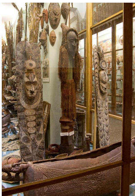
Collectie Papoea Nieuw-Guinea