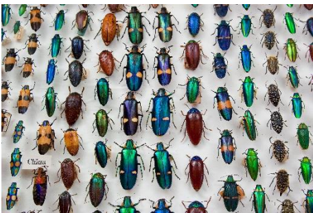
Lade met juweelkevers (detail)

Objectnr. 02041, herkomst: China, India, Indonesië.