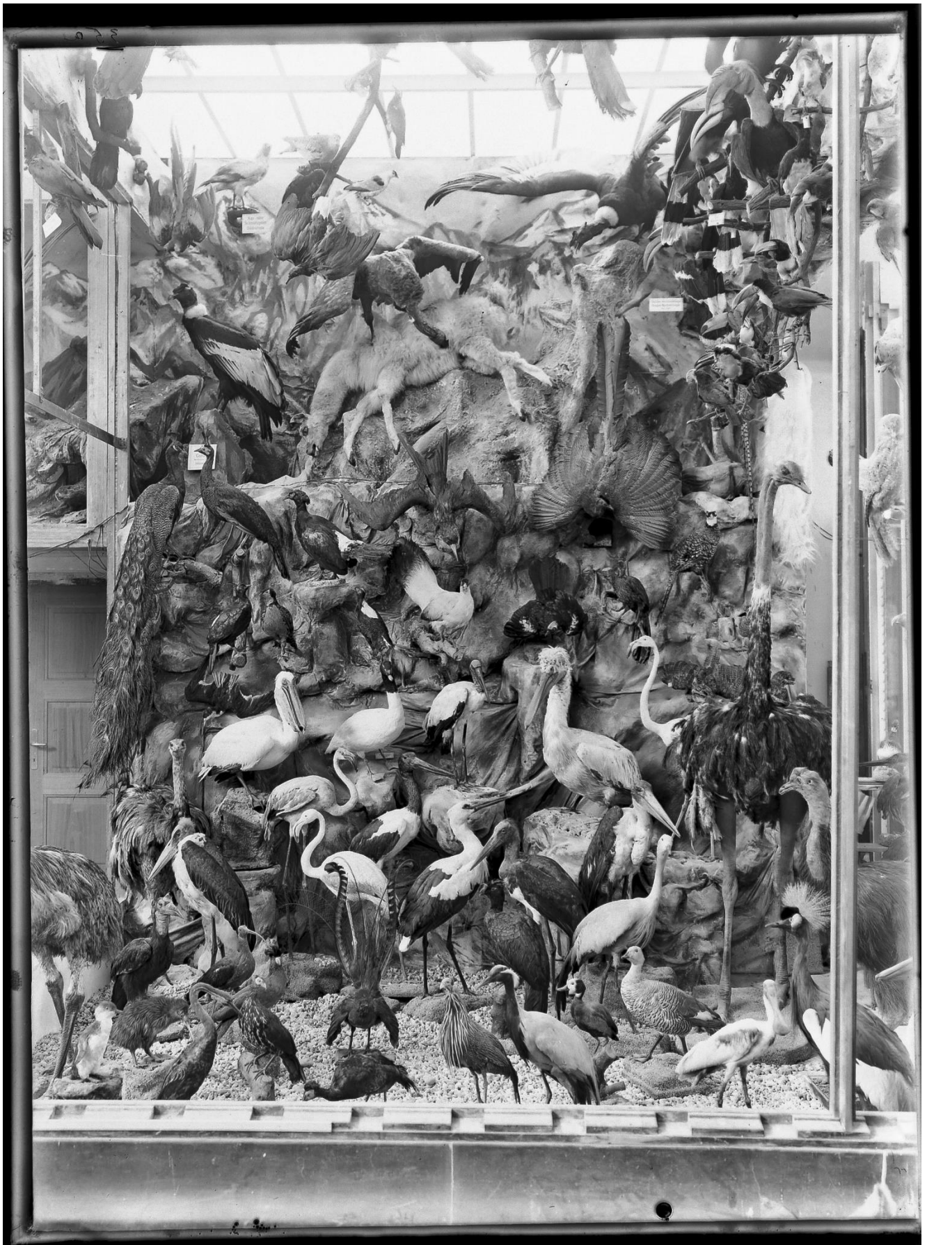
Vitrine grote exotische vogels (oude opstelling)

Digitale scan van een glasnegatief, datum onbekend. Missiehuis St. Michael (SVD), langdurig bruikleen, 1931.