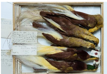
Lade handelsexemplaren kleine paradijsvogel – Paradisaea minor

zaal aan een directe buitenmuur. Hierdoor kunnen de temperaturen in de zomer meer oplopen dan wenselijk is voor collectiebehoud. Verder zijn deze ruimtes redelijk goed afgesloten en is de lichtinval beperkt of geëlimineerd. Dit betekent echter ook dat er weinig luchtcirculatie plaatsvindt en vocht langer blijft hangen. Ook is er een directe deur naar buiten in de museumzaal zonder bufferruimte, al wordt deze alleen gebruikt als nooddeur. Hier zou ook een aanpassing bij gewenst zijn. Boven de hoofdzaal bevinden zich studentenflats, die een groot risico zijn voor de collectie. Ook dit moet meegenomen worden in een overkoepelend plan voor de gebouwen, in overleg met Stichting Kloosterdorp Steyl (verhuurder/beheerder van het gebouw).